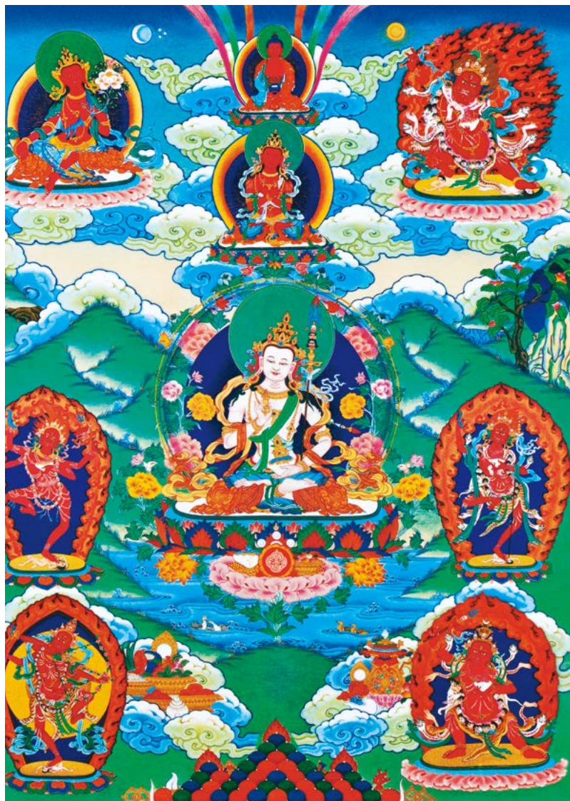
གར་དབང་ལྷ་དགུ་ལ་ན་མོ། 南无怀业九本尊