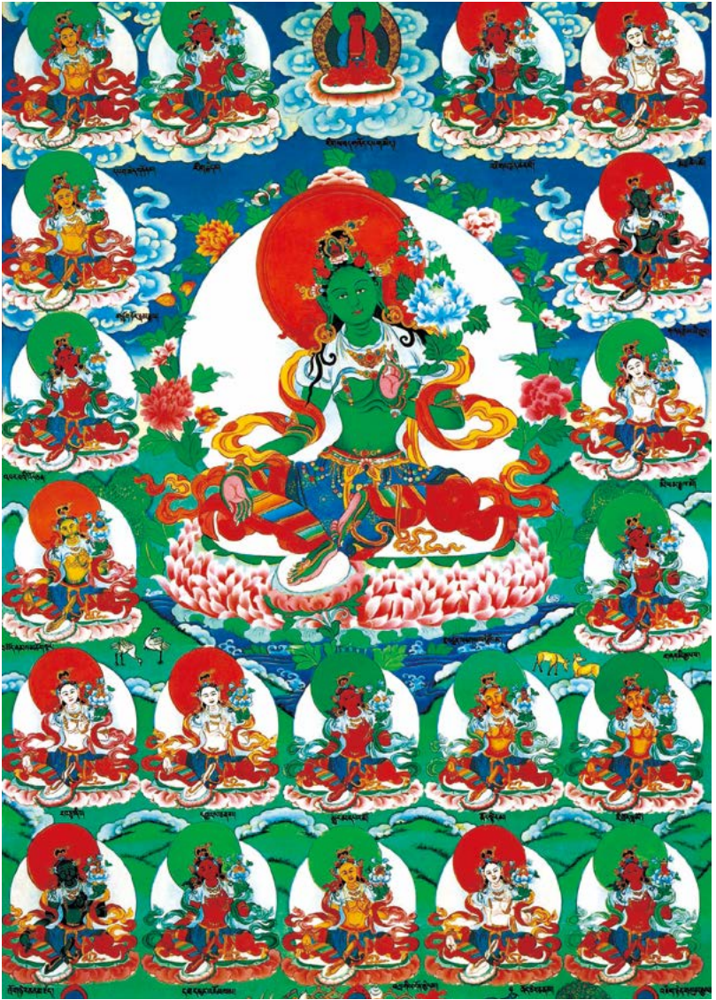
འསགས་མ་སྒྲོལ་མ་ཉེར་གཅིག་ལ་ན་མོ། 南无二十一度母