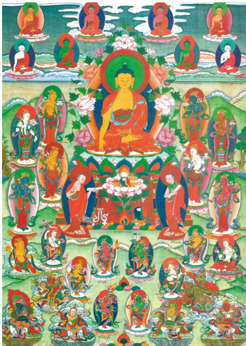
བཀྲ་ཤིས་བརྒྱད་པའི་ཚོགས་ཞིང་། 圣八吉祥