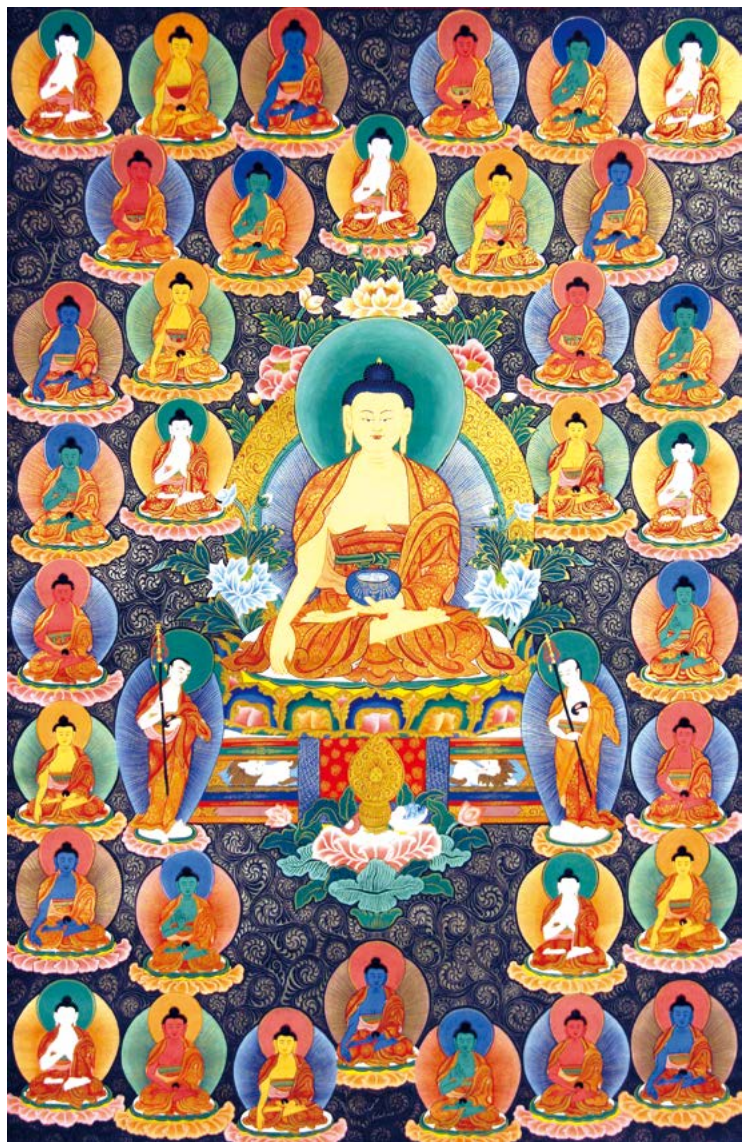
སངས་རྒྱལ་སོ་ལྔ་ལ་ན་སོ། 南无三十五佛