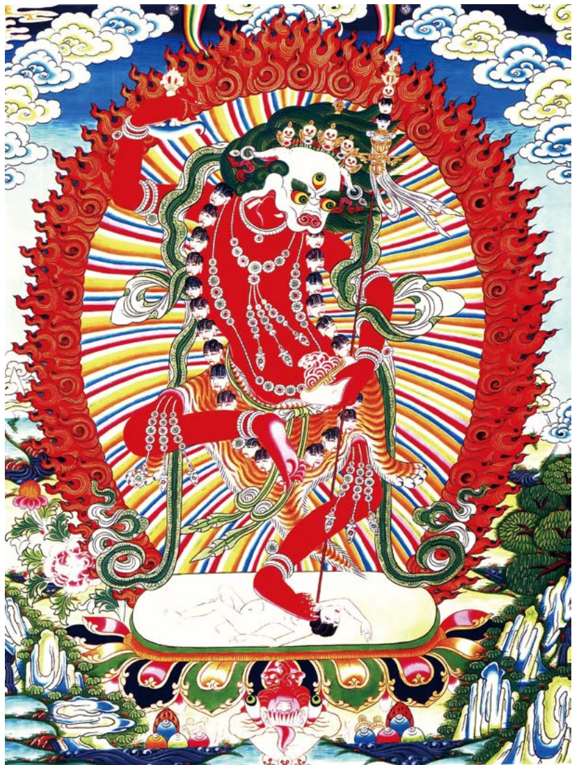
སེང་གཞོང་མ་ལ་ན་མོ། 南无狮面佛母