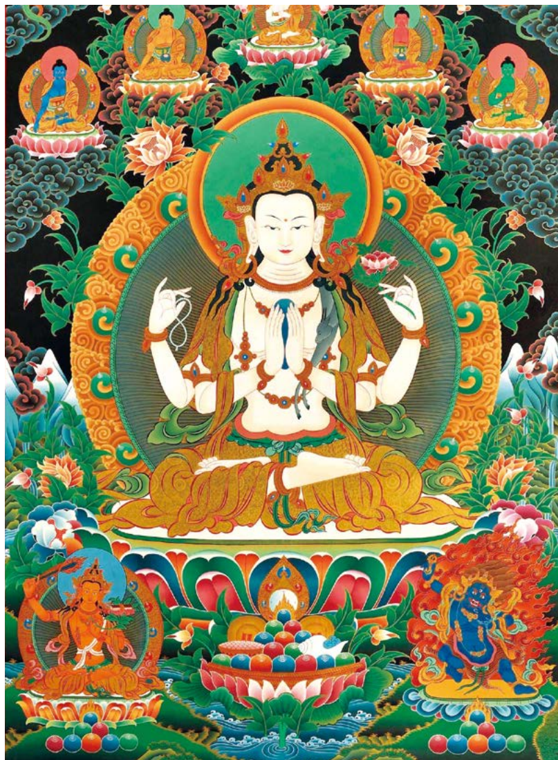
འདམགས་པ་སྐྱེན་རས་གཟིགས་ལ་ན་མོ། 南无观音菩萨