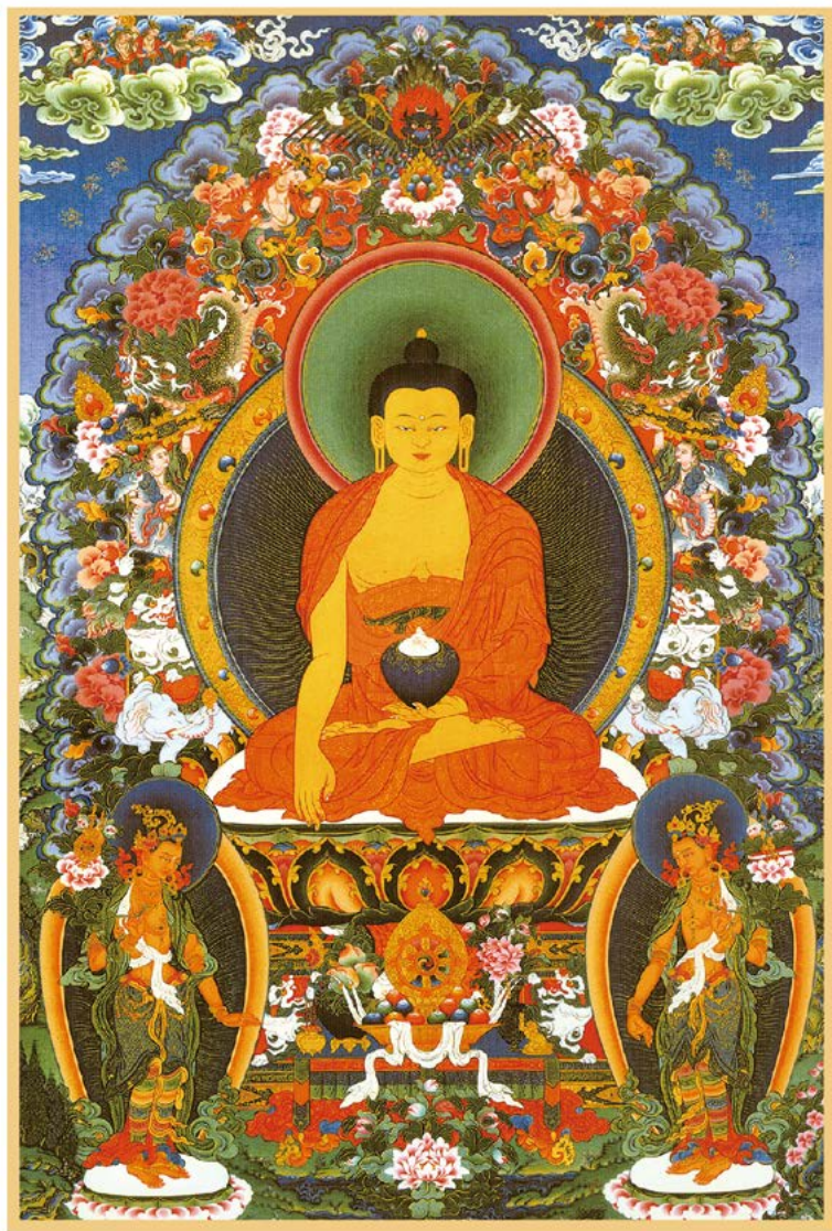
སངས་རྒྱལ་ལྷན་ཐུབ་པ་ལ་ན་མོ། 南无本师释迦牟尼佛