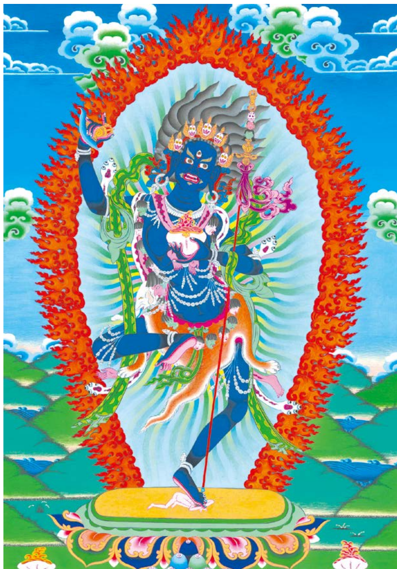
ནོར་ལོ་མོ་ལ་ན་མོ། 南无金刚忿怒母