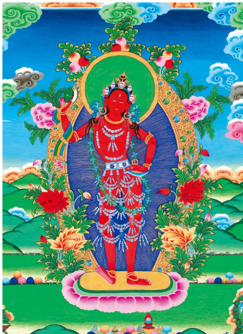
དཱེི་ཀླུ་འབྱུང་མ་ལ་ན་མོ། 南无金刚瑜伽母