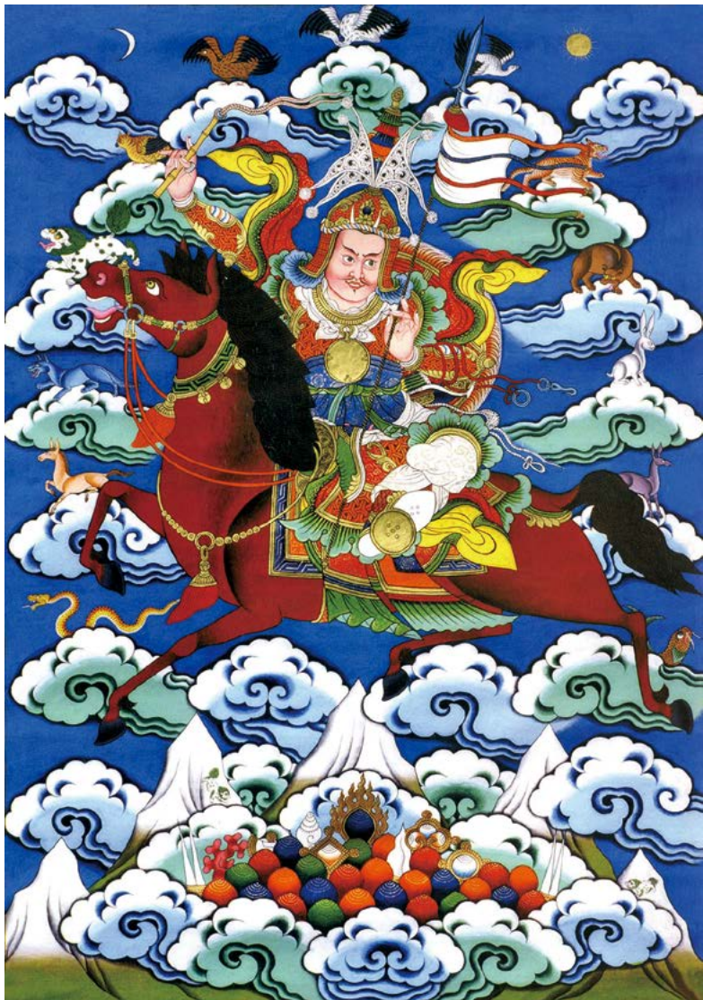
གེ་སང་རྒྱལ་པོ་ལ་ན་མོ། 南无格萨尔王