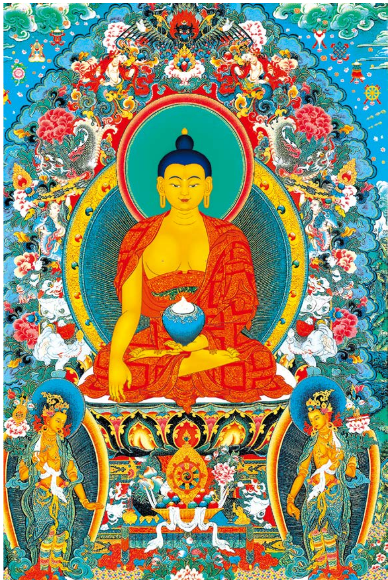
སངས་རྒྱས་ལྷན་ཐུབ་པ་ལ་ན་མོ། 南无释迦牟尼佛