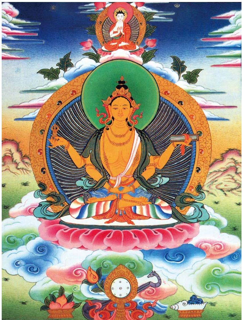
ཚོས་སྐུ་ཡུམ་ཆེན་མོ་ལ་ན་མོ། 南无般若佛母